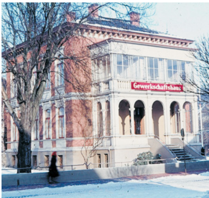
Historische Ansicht: Auch als Gewerkschaftshaus wurde die „Villa Levinson“ an der Hindenburgstraße einst genutzt. Die namensgebenden Besitzer waren jüdischen Glaubens und wurden Opfer des Nationalsozialistischen Regimes.

Rundgang am Sonntag, 13. November, ab 11 Uhr